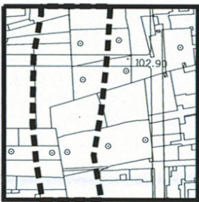
Limite dell' area di rischio idrogeologico "PAI"

Limite della zona ad alta pericolosità idraulica e ad alto rischio alluvionale definita dal vigente piano stralcio di assetto idrogeologico regionale. ( PAI )